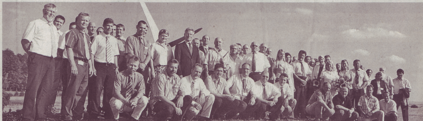
Große Freude beim Steinmetzer-Team über den Supplier-Award.

Steinmetzer CNC Dreh- und Frästechnik GmbH Zeppelinstraße 14 89555 Steinheim Telefon: (0 73 29) 91 86-0 Fax: (0 73 29) 91 86-25 jmh@cnc-steinmetzer.de www.cnc-steinmetzer.de