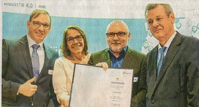
Auszeichnung bei „100 Orte für Industrie 4.0 in Baden-Württemberg“

te man die Sägerei und den Fuhrpark aus, um Platz für weitere CNC-Maschinen zu schaffen. 2016 beschritt Steinmetzer den entscheidenden Weg in die Industrie 4.0. Schon seit 2014 werden mit dem ERP-System die Produktionsabläufe digitalisiert. Neue Fachkräfte verstärken das Team und der Umsatz wurde 2016 um 20 Prozent gesteigert. Als eine der ersten Firmen wurde Steinmetzer damals nach der neuen ISO Norm 9001-2015 erfolgreich zertifiziert. Weitere Investitionen erfolgten. Derzeit beschäftigt das hochmoderne Steinheimer Unternehmen 45 Mitarbeiter und bearbeitet rund 800 Tonnen Aluminium auf Fertigungsmaschinen mit einem durchschnittlichen Alter von fünf Jahren. Aktuell vertritt man bei Steinmetzer die Philosophie: „Wir wollen nach vorne schauen und alles daran setzen, um unsere Kunden zu unseren Fans zu machen“.